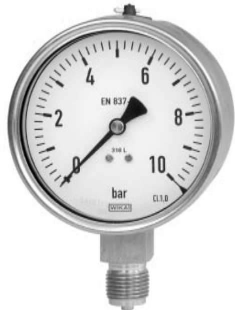
Manometr z rurką Bourdona, model 232.50

Zakres pomiarowy NS 63: 0 ... 1 do 0 ... 1000 bar NS 100: 0 ... 0,6 do 0 ... 1000 bar NS 160: 0 ... 0,6 do 0 ... 1600 bar lub równowartość w innych jednostkach pomiaru ciśnienia lub w próżni